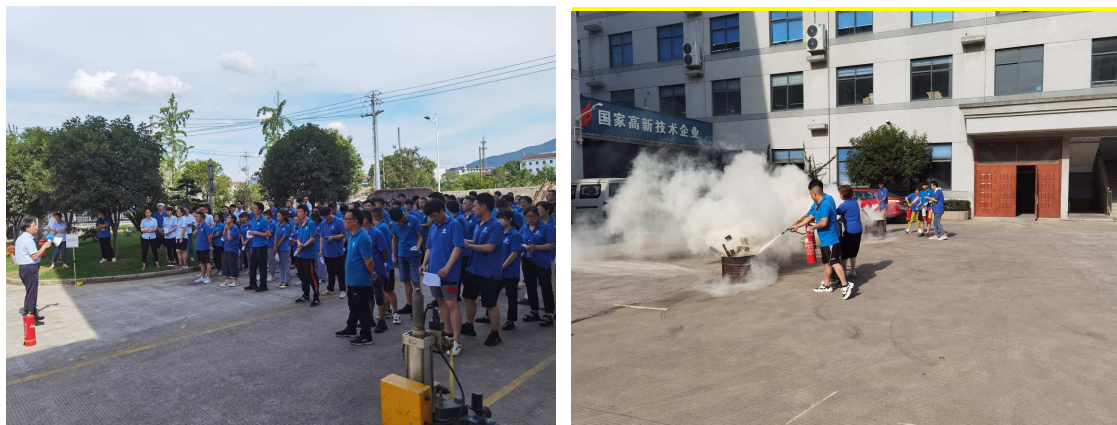
图 6.3-01 公司应急演练现场

公司每年举行消防演练和各种灾害应急演练。公司制订了《危险源辨识/风险评价和风险控制程序》、突发环境事件应急预案等，对火灾、触电、台风、中暑等均有相应的应急措施，并成立了应急指挥部和办公室。