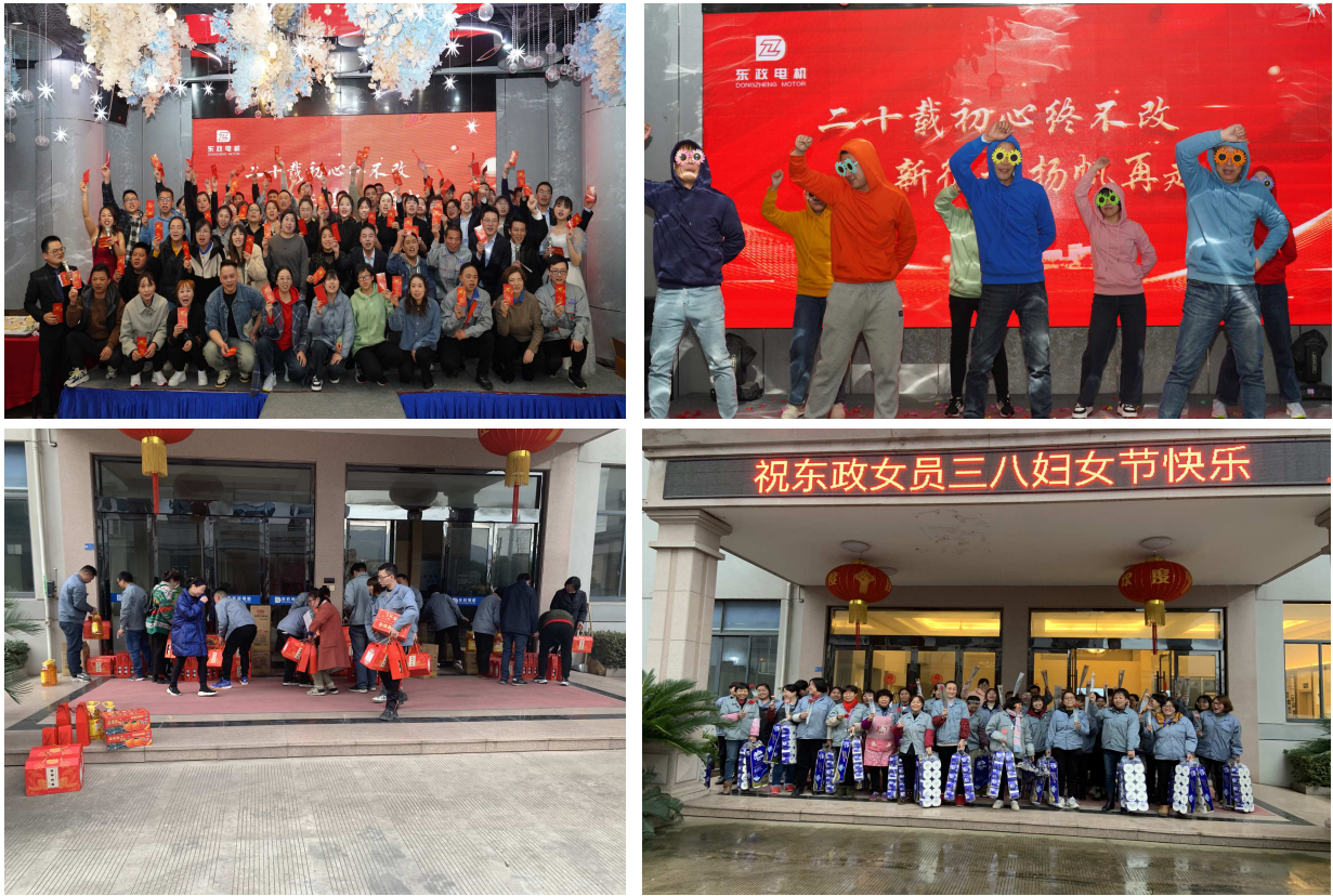
图 3.2-2 丰富多彩的文化活动

公司将东政的价值观、战略目标及业务战略编制成《公司章程》，使之成为公司每位员工必须知晓和遵守的“公司宪法”，涵盖了公司宗旨、基本经营政策、基本组织政策、基本人力资源政策、基本管理控制政策等内容。本着持续改进、民主决策的理念，《公司章程》每五年修订一次，由公司各层级优秀员工与董事会共同商议讨论并审核通过，确保宪章内容的合理性和实用性，提高企业文化执行力。