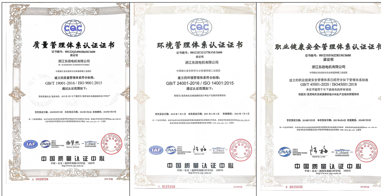
质量管理体系认证